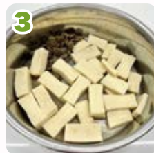
3 絞って水分を飛ばし、3~5ミリ幅にカット