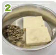
2 高野豆腐を1で使用したお湯で戻す