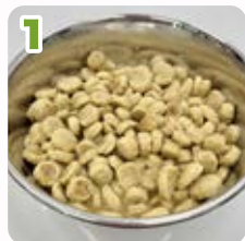
1 ドライフードをお湯でふやかす