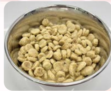
ふやかしたドライフード

シニアの子では、このような原因で食欲がなくなったり、食べるのに時間がかかったりすることがあります。