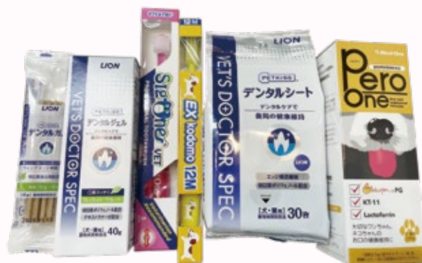
当院で取り扱っているデンタルケア製品

ガムはデンタルケア製品の中で1番手に取りやすいのですが、噛むのに使う歯と使わない歯があります。使う歯には有効ですが、使わない歯への効果が弱く、歯と歯茎の間(歯周ポケット)の歯垢は落とすことができないので、やはり歯ブラシでの歯磨きは必要です。デンタルガムは歯磨きと併用して使いましょう。